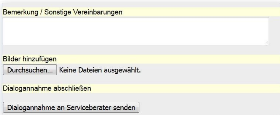
Abb.1.4 Dialogannahme abschließen

Die fertige Dialogannahme wird dann als PDF-Dokument an die E-Mail-Adresse des Serviceberaters gesendet.