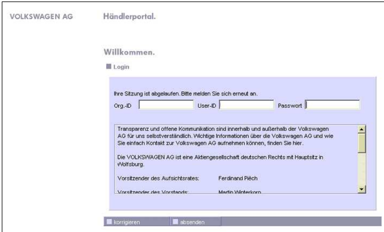
Abb. 1.2 Zur Nutzung ist die Anmeldung am Händlerportal notwendig.