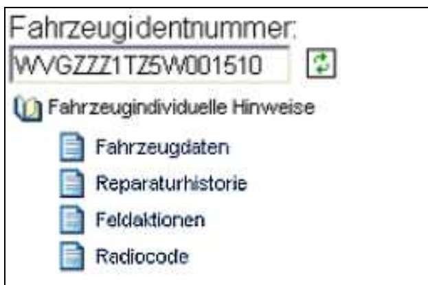
Abb. 1.3 Über die Fahrzeugidentnummer werden alle Informationen zum betreffenden Fahrzeug angezeigt. Die Identnummer wird automatisch vom System übernommen.