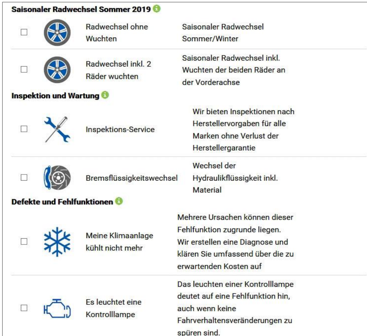
Abb.1.1 Website zur Auswahl der Arbeiten

Hinweis: Bitte setzen Sie sich mit Ihrer IT-Firma in Verbindung, um die Anzeige der Online-Terminbuchung auf Ihrer Website einzubinden.